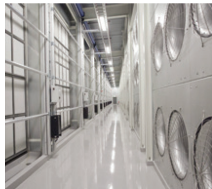
ЦОД Facebook, Швеция