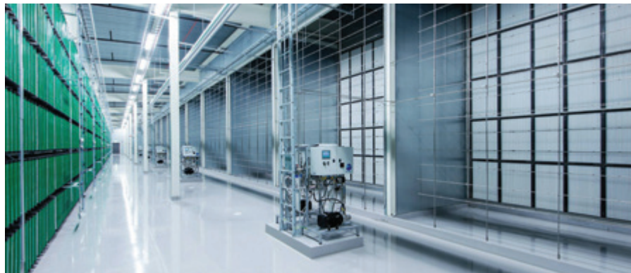
ЦОД Facebook, Швеция